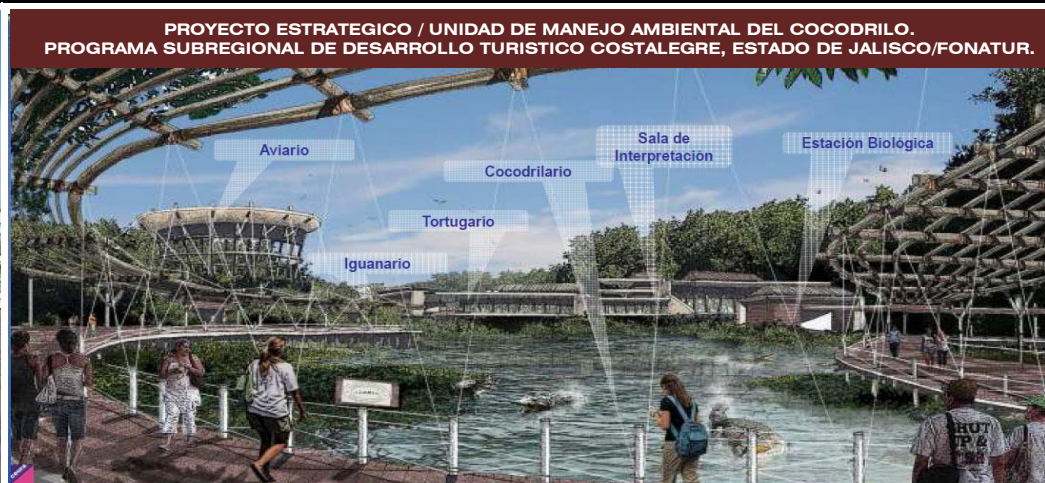
PROYECTO ESTRATÉGICO / UNIDAD DE MANEJO AMBIENTAL DEL COCODRILO. PROGRAMA SUBREGIONAL DE DESARROLLO TURISTICO COSTALEGRE, ESTADO DE JALISCO/FONATUR.