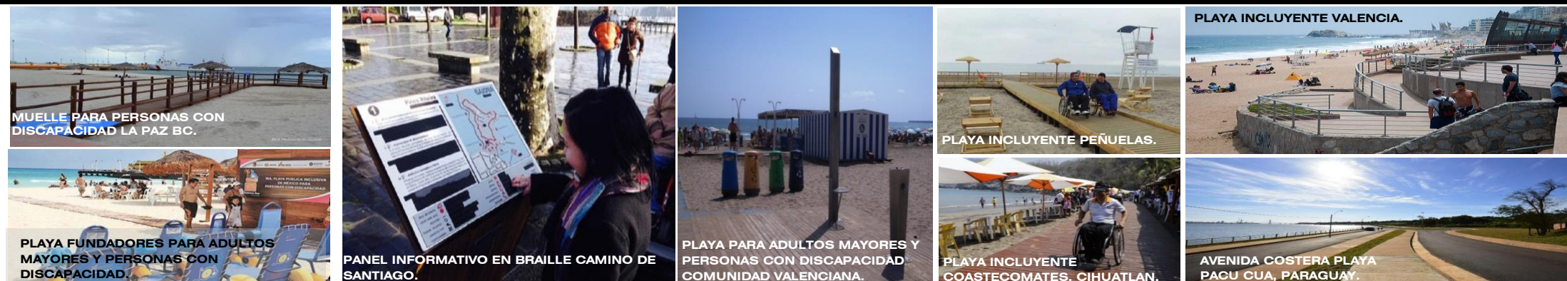
MUELLE PARA PERSONAS CON DISCAPACIDAD LA PAZ BC.