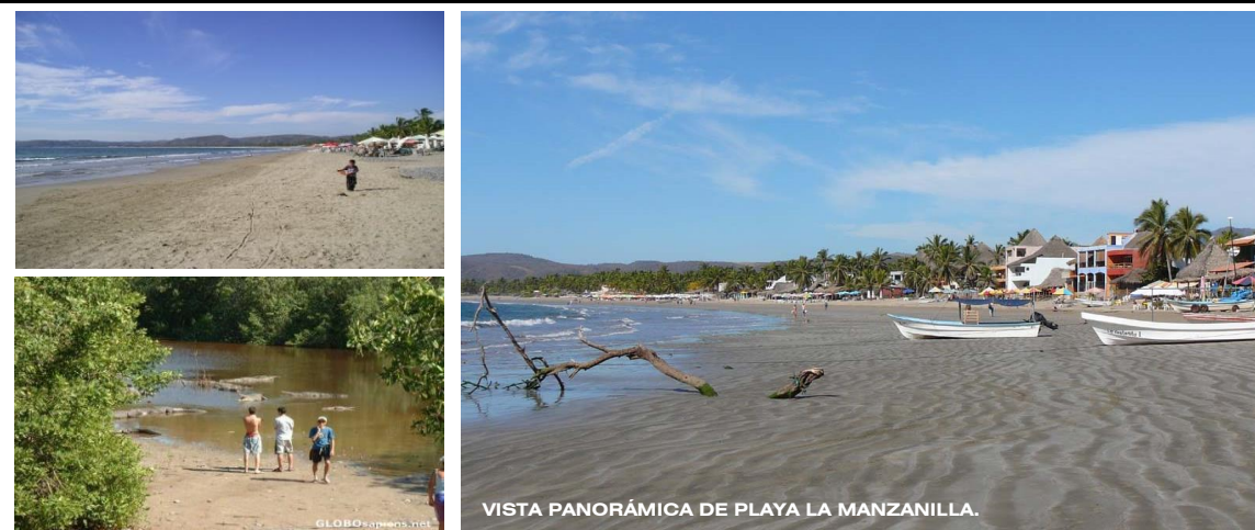
VISTA PANORÁMICA DE PLAYA LA MANZANILLA.