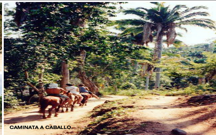
CAMINATA A CÁBALLO.