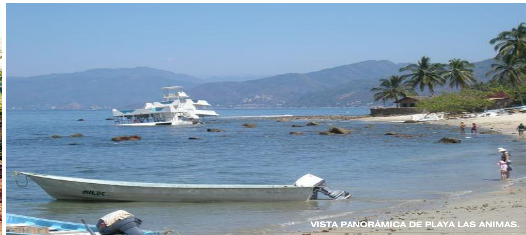
VISTA PANORÁMICA DE PLAYA LAS ANIMAS.