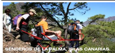
SENDEROS DE LA PALMA, ISLAS CANARIAS.