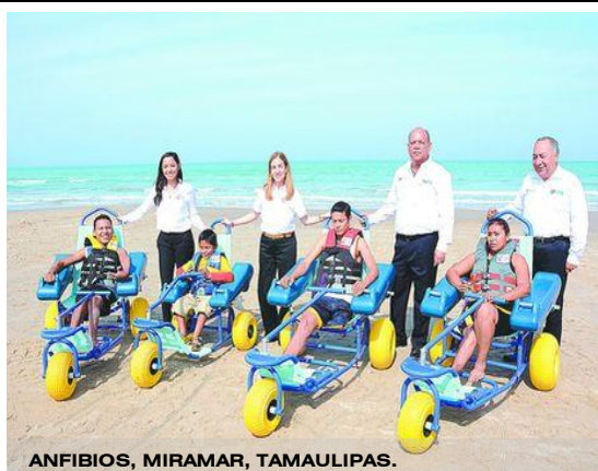
ANFIBIOS, MIRAMAR, TAMAULIPAS.

NOTAS GENERALES DE DISEÑO UNIVERSAL: TODAS LAS ÁREAS DEBEN ESTAR UNIDAS DEBIDAMENTE MEDIANTE LA ACCESIBILIDAD UNIVERSAL: / CAMINOS CON UN ANCHO MÍNIMO A 160 CM PARA PERMITIR LA CIRCULACIÓN, LA SUPERFICIE DEBERÁ SER DE UN MATERIAL ANTIDERRAPANTE, ESTABLE Y SEGURO. / LAS ALTURAS EN EL MUELLE DEBERÁN SER LAS ADECUADAS TANTO PARA PERSONAS EN SILLA DE RUEDAS COMO PARA PERSONAS QUE ESTÉN DE PIE. / LAS RAMPAS DEBERÁN TENER UNA PENDIENTE NO MAYOR A 10%. / IMPLEMENTAR CAMINOS QUE CONECTEN A LOS SERVICIOS YA INSTALADOS. / EL MOBILIARIO URBANO DEBERÁ ESTAR FUERA DE LOS SENDEROS PARA EVITAR OBSTRUIR LA CIRCULACIÓN Y GENERAR OBSTÁCULOS PARA PERSONAS CON DISCAPACIDAD. / TODOS LOS MATERIALES TANTO DE LOS CAMINOS COMO DE LOS MOBILIARIOS DEBERÁN SER PROPIOS DE LA REGIÓN PARA EVITAR MODIFICAR LA IMAGEN URBANA. / EL ESTANQUE DEBERÁ CONTAR CON UNA PROFUNDIDAD QUE NO GENERE RIESGO PARA LAS PERSONAS DISCAPACITADAS, ADEMÁS CONTARÁ CON UN PEQUEÑO MUELLE PARA LOS QUE NO QUIERAN ACCEDER AL AGUA. / EN LAS ÁREAS INTERPRETATIVAS SE REALIZARÁN ACTIVIDADES QUE PERMITAN TANTO A LOS TURISTAS CON DISCAPACIDAD EXPERIMENTAR CON DIFERENTES ACTIVIDADES: MAQUETAS DE RECONOCIMIENTO TÁCTIL, OLORES, ETC. / LOS MATERIALES QUE SE UTILICEN SERÁN DE MANERA SOSTENIBLE. / LAS PARRILLAS DEBERÁN MEDIR ENTRE 45 O 60 CM DE ALTURA Y TENER UNA DISTANCIA DE LA MESA DE 150 CM. / LA VISIBILIDAD NO DEBE SER OBSTRUIDA, LAS ALTURAS MÁXIMAS DE LOS PASAMANOS SERÁN DE 80 CM.