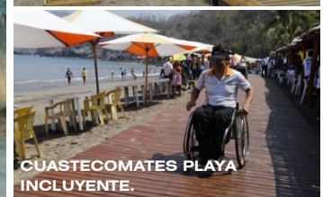
CUÁSTECOMATES PLAYA INCLUYENTE.