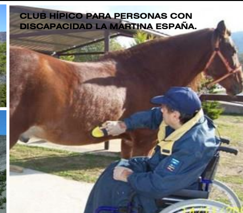
CLUB HÍPICO PARA PERSONAS CON DISCAPACIDAD LA MÁRTINA ESPAÑA.