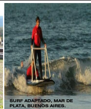
SURF ADAPTADO, MAR DE PLATA, BUENOS AIRES.