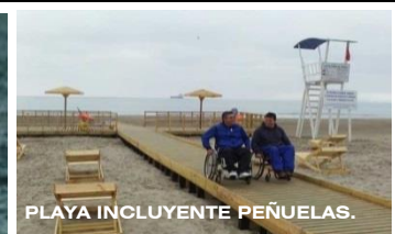
PLAYA INCLUYENTE PEÑUELAS.