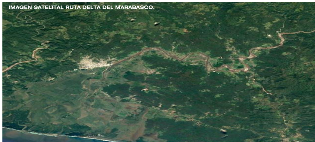
IMAGEN SATELITAL RUTA DELTA DEL MARABASCO.