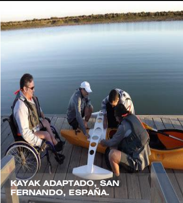
KAYAK ADAPTADO, SAN FERNANDO, ESPAÑA.