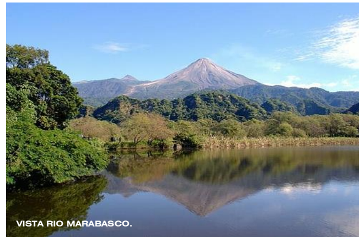
VISTA RIO MARABASCO.