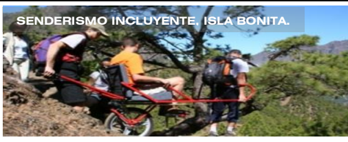
SENDERISMO INCLUYENTE, ISLA BONITA.