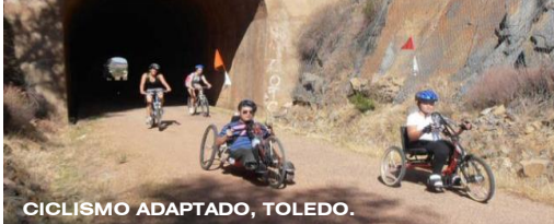
CICLISMO ADAPTADO, TOLEDO.