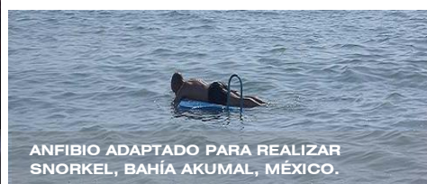
ANFIBIO ADAPTADO PARA REALIZAR SNORKEL, BAHÍA AKUMAL, MÉXICO.