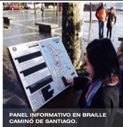
PANEL INFORMATIVO EN BRAILLE CAMINO DE SANTIAGO.