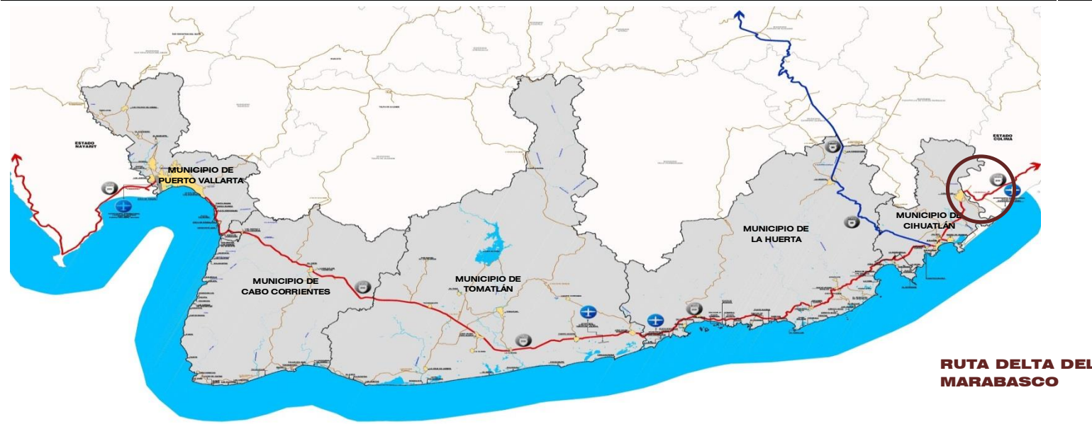
RUTA DELTA DEL MARABASCO