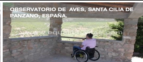
OBSERVATORIO DE AVES, SANTA CILIA DE PANZANO, ESPAÑA.