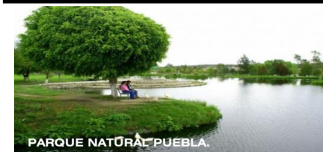
PARQUE NATURAL PUEBLA.