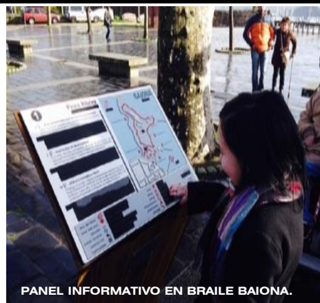
PANEL INFORMATIVO EN BRAILLE BAIONA.