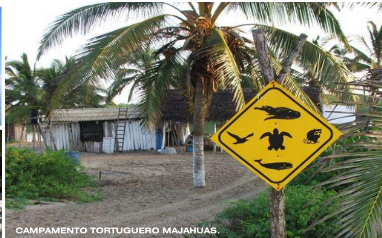
CAMPAMENTO TORTUGUERO MAJAHUAS.