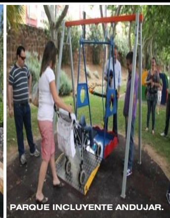
PARQUE INCLUYENTE ANDUJAR.