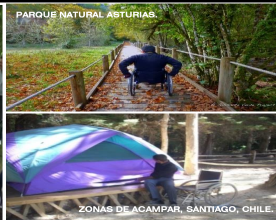
PARQUE NATURAL ASTURIAS.