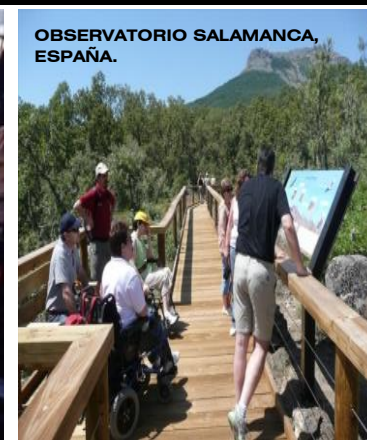
OBSERVATORIO SALAMANCA, ESPAÑA.