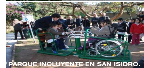
PARQUE INCLUYENTE EN SAN ISIDRO.