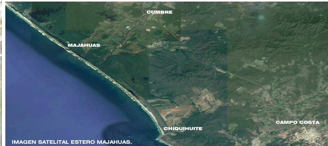
IMAGEN SATELITAL ESTERO MAJAHUAS.