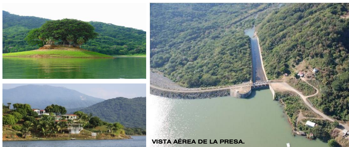
VISTA AÉREA DE LA PRESA.